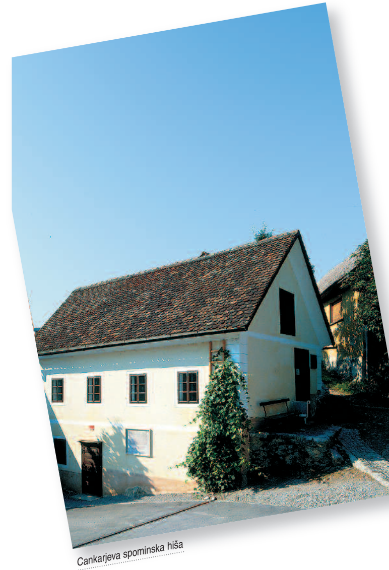
Cankarjeva spominska hiša