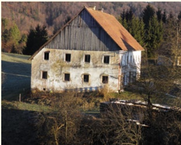
V tej domačiji so včasih živeli vojaki, danes je prazna.

Na višku gradnje je bunkerje na celotni liniji gradilo 60.000 vojakov in civilistov v treh izmenah. V času gradnje so bivali v vojaških taborih in pri domačinih. Eden izmed največjih vojaških taborov je bil na pobočju Strmice, kjer naj bi bivalo preko 1.000 vojakov. Ena izmed domačij, kjer so se nastanili, je bila domačija Pr´Omejc.